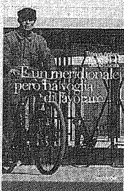
Copertina Le foto del racconto per immagini

All'interno del festival il «Cinema italiano visto da Milano», domani si discute in Sala Alessi (e si vede) la storia per immagini curata da Uliano Lucas e Tatiana Agliani. A sinistra, due foto dell'epoca: «Senza casa», del 1965, e immigrati alla Centrale, dello stesso periodo