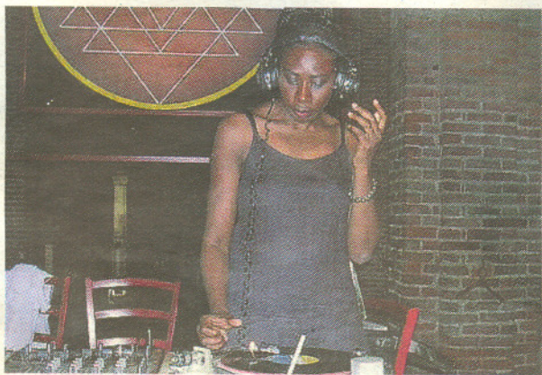
Funk La dj Kleopatra e sopra una festa alla Triennale Bovisa

buffet tran (leg Nier man gli e Siro Gi Wu nim non soll Ediz sull tem la s