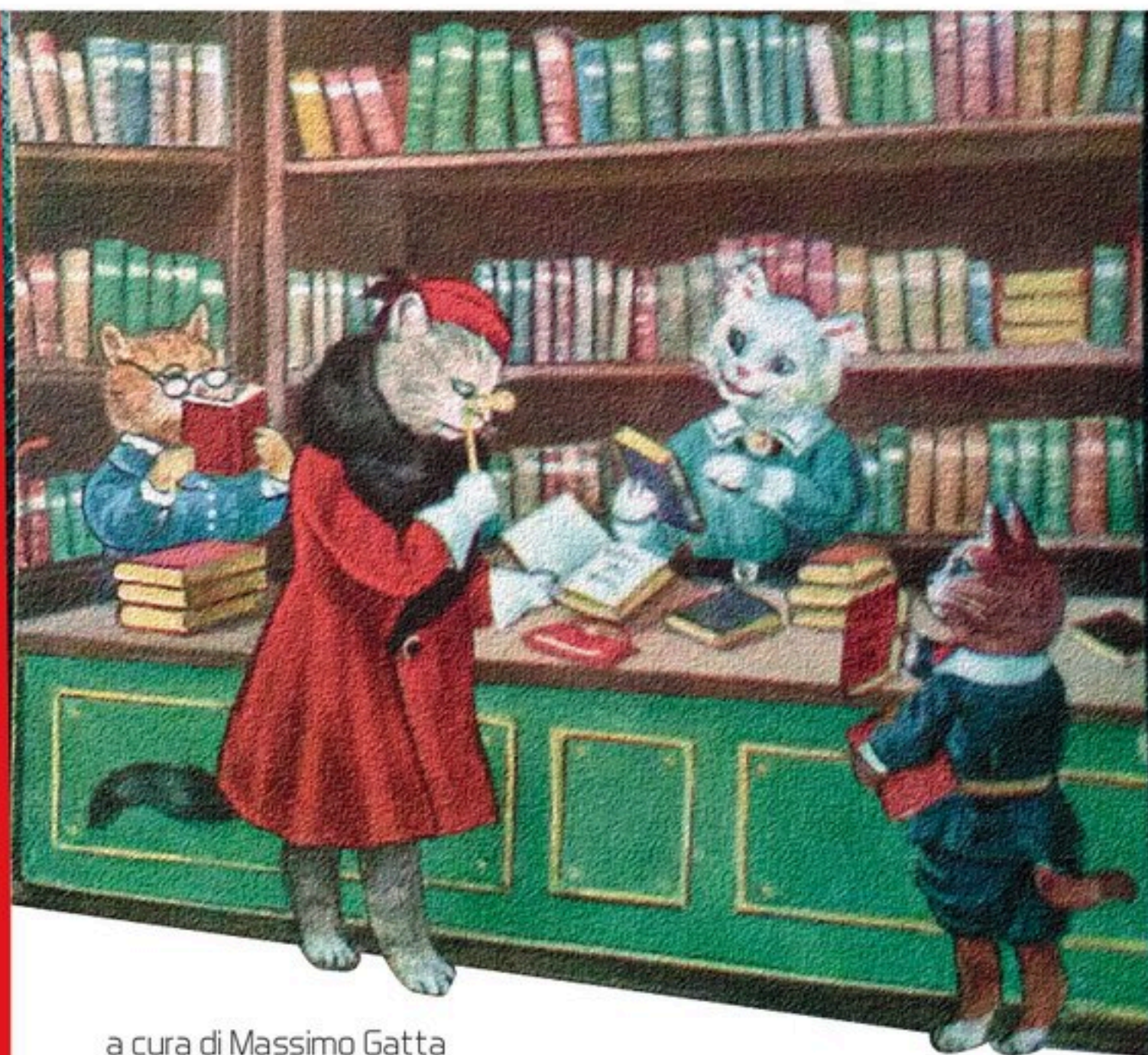
a cura di Massimo Gatta

N uovo anno e nuovo appuntamento di segnalazioni bibliografiche dal desco gattesco , ormai liberato da panettone, spumante e dolci vari. Partiamo per questo 2023 non da un libro ma da una raffinata realizzazione tipografica, legata però in qualche modo sempre ai libri. Segnalo quindi l'elegante e raffinato ex libris realizzato da "Anonima Impressori" di Luca Lattuga, operante a Bologna, per il Centro Apice di Milano, in occasione dei 20 anni di attività di questo prestigioso centro uni-